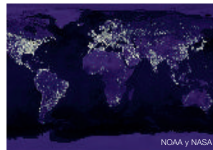
NOAA y NASA