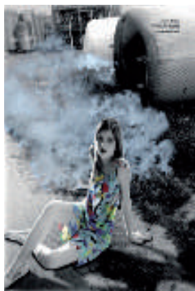
Revista de Greenpeace, junio 2006

¿Has pensado alguna vez si nuestra manera de vivir puede afectar a otras personas y seres vivos del planeta, y de qué manera? ¿Sabes todo lo que pasa antes de que llegue lo que compramos a las tiendas, y adónde van después los residuos?