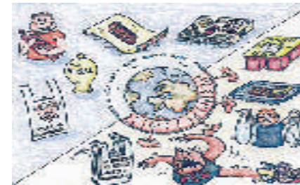
Dibujo publicado en la Revista Aula Verde nº 25. Consejería de Medio Ambiente de la Junta de Andalucía. Angel Rodríguez Ramírez. Red Anda-luza de Consumo Responsable.

Mira el dibujo con atención. ¿Cómo crees que podemos llevar a cabo un consumo responsable? Di 6 ejemplos de consumo responsable que puedas hacer tú en el día a día.